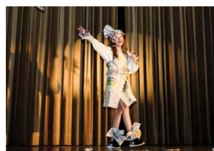
Alpadia's got Talent