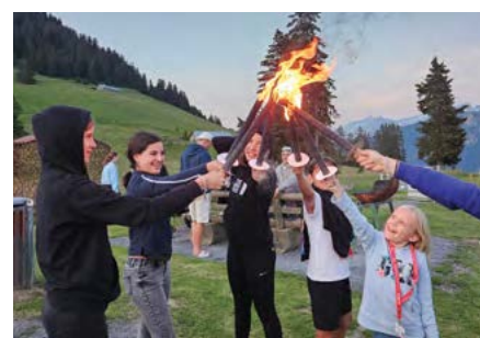
Camminata notturna con torce